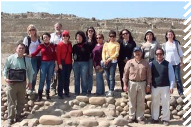
Alguns dos membros de SAPUVETNET na cidade sagrada de Caral, a cidade mais antiga da América.