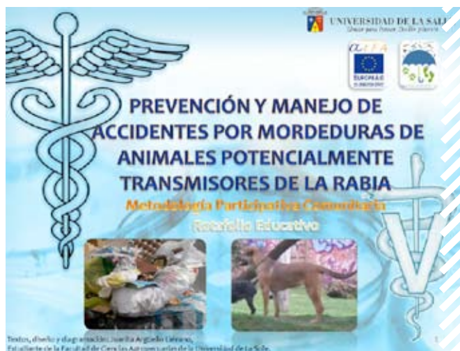
Flipchart sobre raiva.