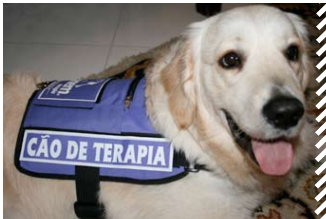
Trevo, cão de Terapia da delegação Canem Lisboa.

A Terapia Assistida com Animais (TAA) é uma modalidade terapêutica na qual um animal, que cumpre determinados requisitos, é parte integrante e fundamental do projecto. Neste tipo de terapia uma equipa multidisciplinar de profissionais da saúde (Psicólogos, Terapeuta Ocupacional, etc.) responsáveis por traçar os objectivos terapêuticos individuais de cada paciente e seguir toda a sua evolução, colaboram com um Guia Canino, que se encarrega do controlo do animal, da avaliação do seu comportamento e adequação aos objectivos programáticos definidos, e um treinador profissional, que pode não estar presente, mas que desempenha um papel fundamental na educação e treino do cão. É assim um mundo novo, que vale a pena conhecer e desenvolver.