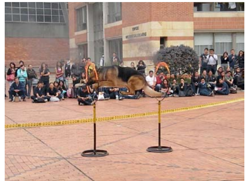
Show de agility de cães, Policia Nacional da Colômbia, Universidade de la Salle.

Divulgação de Jornadas de Vacinação gratuita de animais de companhia no Uruguai.